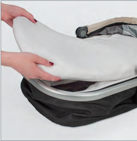
STEP 1: Remove mattress.