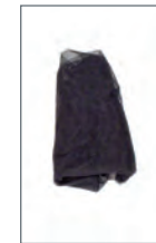
Malla Antimosquitos para el Capazo