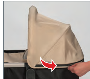
STEP 1: Unzip the bottom zipper on the canopy hood.