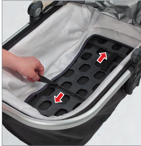
STEP 2: Pull both steel braces firmly towards the outer ends of the bassinet into their respective sockets. Make sure both braces are properly locked in place.