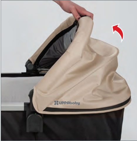
STEP 3: Pull bassinet canopy handle upright until an audible “click” is heard.