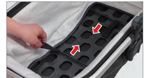
STEP 2: Lift mattress out of the way. Disengage by pulling steel braces from their respective sockets.