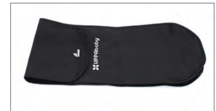
Sac de Rangement de la Nacelle