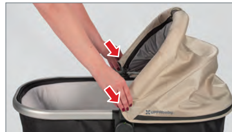
STEP 1: Collapse bassinet canopy by simultaneously pressing buttons on both sides and pushing back.