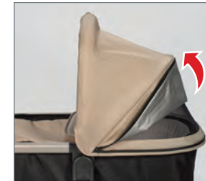
STEP 2: Lift and line up seam half-way until magnets connect.