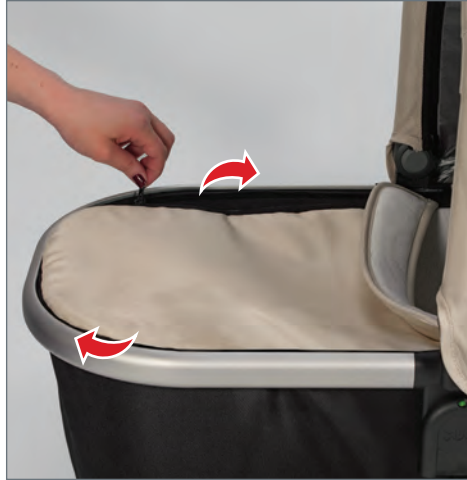
STEP 4: Zip bassinet cover onto bassinet frame.